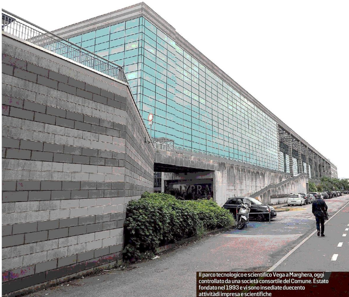
Il parco tecnologico e scientifico Vega a Marghera, oggi controllato da una società consortile del Comune. È stato fondato nel 1993 e vi sono insediate duecento attività di impresa e scientifiche