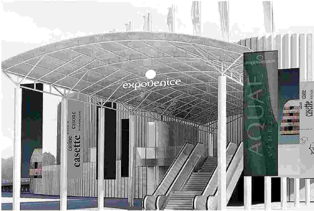
La ricostruzione grafica di come sarà il padiglione che ospiterà l'esposizione "Aqua"