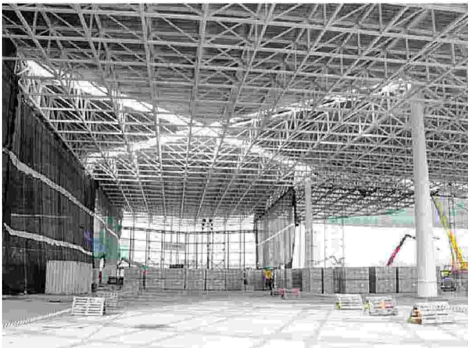
Il padiglione «Aqua» a Marghera, nell'area Vega 2

pali direttrici: la diversificazione dell'offerta e l'identificazione di una nuova modalità di ingresso alla Venezia storica attraverso la geolocalizzazione e la messa in rete delle infrastrutture di accesso. 170 le offerte inserite nel piano. 108 sono luoghi espositivi o percorsi culturali e una sessantina sono servizi e collaborazioni. Altro progetto è quello della piattaforma web Expoveneto.it. Sono 741 le adesioni di aziende, 15 mila gli accessi (più di metà stranieri e molti dagli Usa) e 121 gli eventi presentati. (m.ch.)